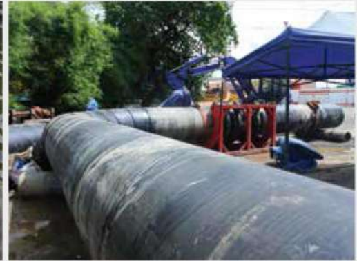
Proyek IPAL Ø1200 mm, PN-12,5, SDR 13,6 Palembang, Sumatera Selatan