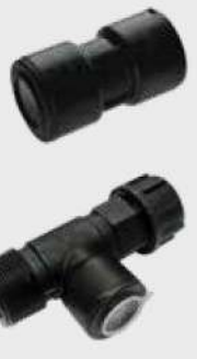
Fitting PUSHON SYSTEM