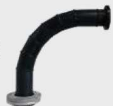
Fitting Fabrication / Segmented