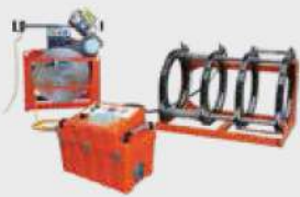
Butt Welding Machine