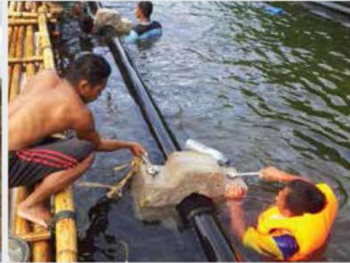
Instalasi Pipa Bawah Laut Kota Mamuju, Pulau Karampuang, Sulawesi Barat