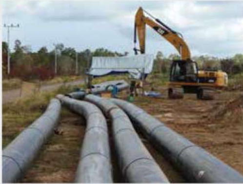
Proyek SDA Perpipedan Air Baku Sungai Maro Merauke, Papua

Dengan massa produk yang ringan, serta ketahanan impact yang baik, menjadikan pipa PE Vinilon lebih efisien serta aman dibandingkan penggunaan logam dan beton dalam segi penanganan dan instalasi.